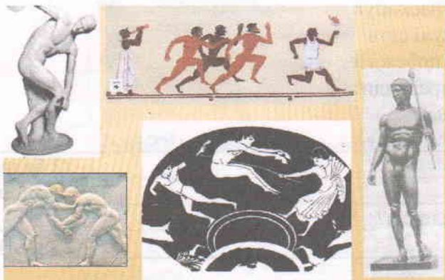
В. Олимпийские игры, Греция + +