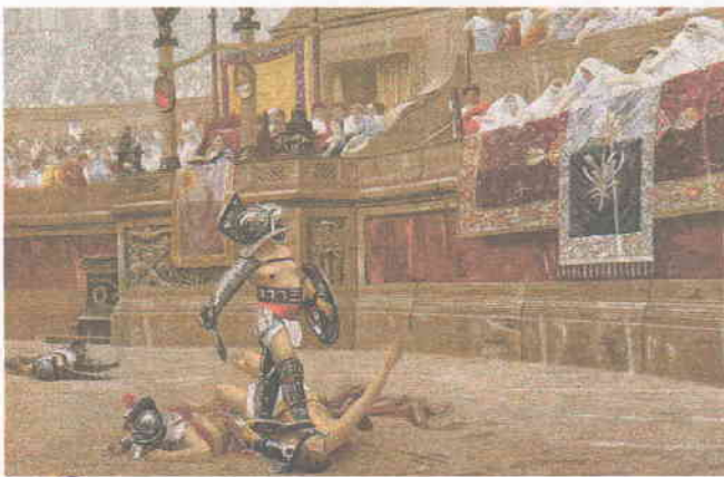
А. Битва +

6. Даны разные иллюстрации, подпишите, какое событие на них изображено? Определите, для какой страны характерно это событие. За каждый правильный ответ 2 балла. Расположите события в хронологическом порядке от самого раннего. За правильную хронологию 2 балла. Всего 10 баллов.